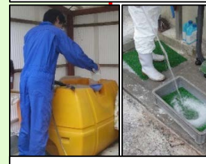
消毒液の定期的交換