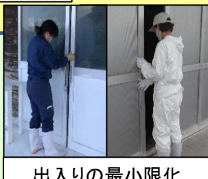
出入りの最小限化