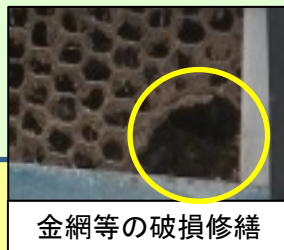
金網等の破損修繕