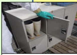
家きん舎専用の靴使用