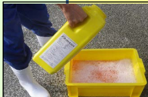
家きん舎毎の消毒