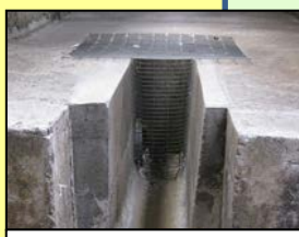
排水溝等からの 侵入防止対策 (鉄格子の設置)