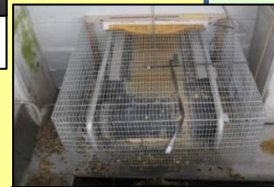
集卵・除糞ベルトの 開口部の隙間対策