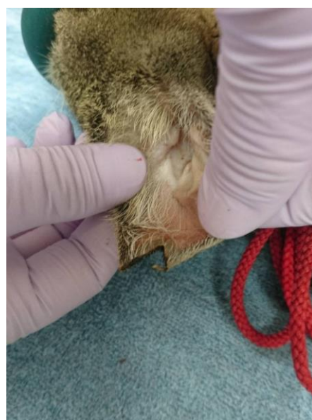
⑤ 鉗子を外して出血がないか確認します。