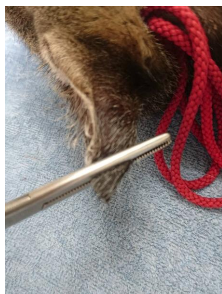
③ 鉗子で挟み、鉗子に沿ってメスで耳先を切ります。