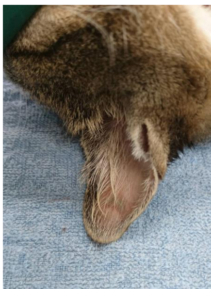
① 右耳の先を消毒します。

オス・メスどちらも 右耳の先 をV字カットします。すでに手術済みだった個体についても耳カットを行ってください。