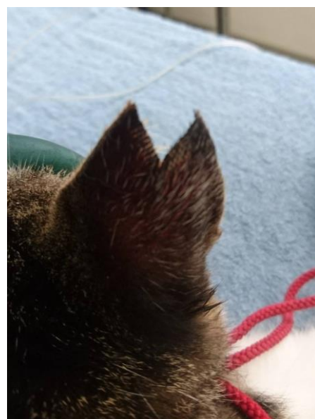
⑥ V字カットの完成です。