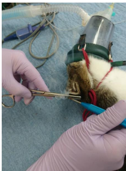
④ 電気メス等で止血します。